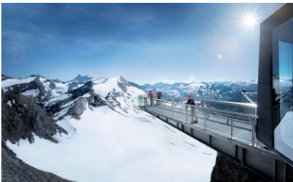
Beispielhaftes Rahmenprogramm Gletscherwelt 3000

*Wir behalten uns vor, das Turnier bei weniger als 32 Anmeldungen abzusagen.