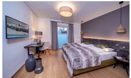
Beispielzimmer Hotel Heitzmann